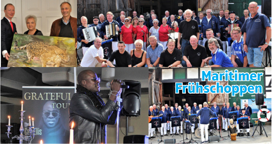
Gospelkonzerte (unten links), der Maritime Frühschoppen auf dem Bauernhof Hegenberg (rechts), die jährliche Aktion „Kunst spendet“ (oben links) - helfende Hände überall. Und ohne SIE geht es auch nicht!